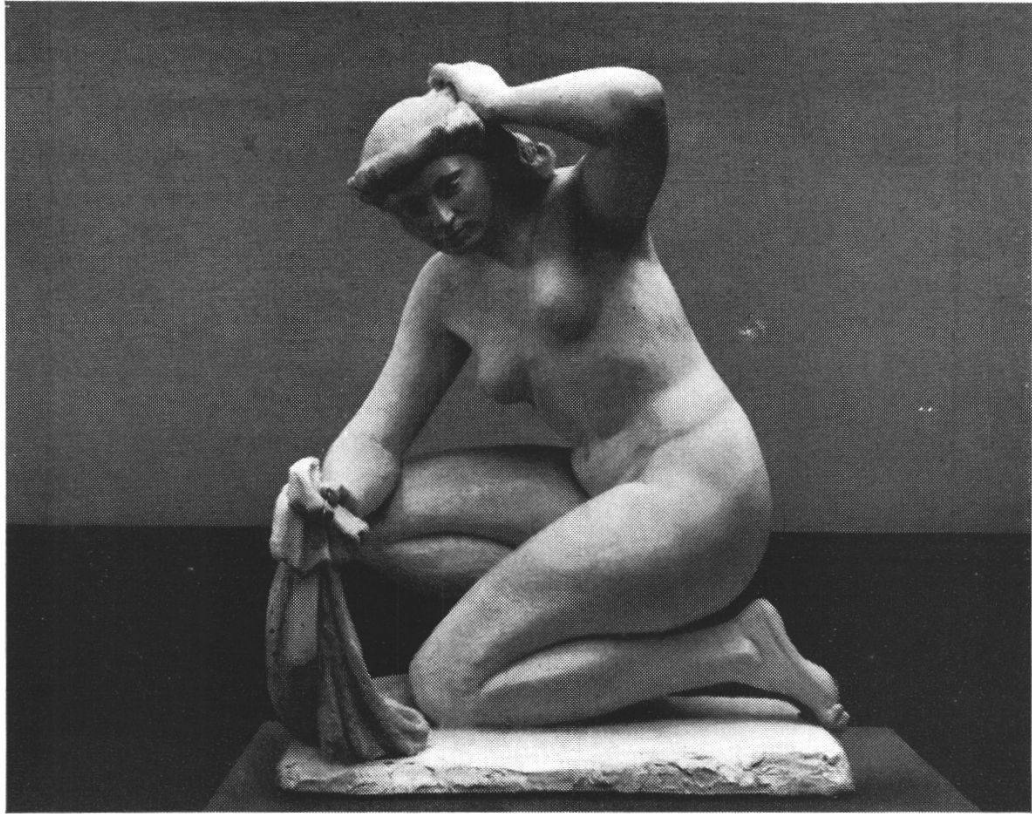
E. Spörri: Kauernde Badende.