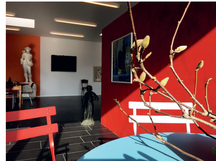
Blick in das Museum Eduard Spörri.

Sonntag, 2. Dezember 2018, 14.00 – 17.00 Uhr Finissage.